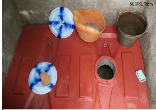
Drop hole in the middle, urine hole with proper slope in the front wash water bowl in the rear